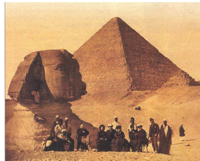
D. Pedro II et sa suite visitant les pyramides en 1876

En 1876, lors de son deuxième voyage en Égypte, Dom Pedro II a reçu comme cadeau du Khédive Ismaïl, roi d'Égypte, le beau cercueil peint de la Chanteuse d'Amon Sha-Amon-em-sou. Dom Pedro II l'a laissé dans son cabinet et on dit qu'il était placé debout à côté d'une fenêtre du palais. Au cours d'une tempête, un coup de vent aurait brutalement ouvert la fenêtre, cassant le côté latéral gauche du cercueil, plus tard restauré.