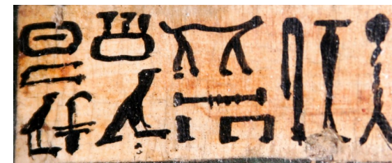
Titre et prénom de la Chanteuse Sha-Amon-em-sou